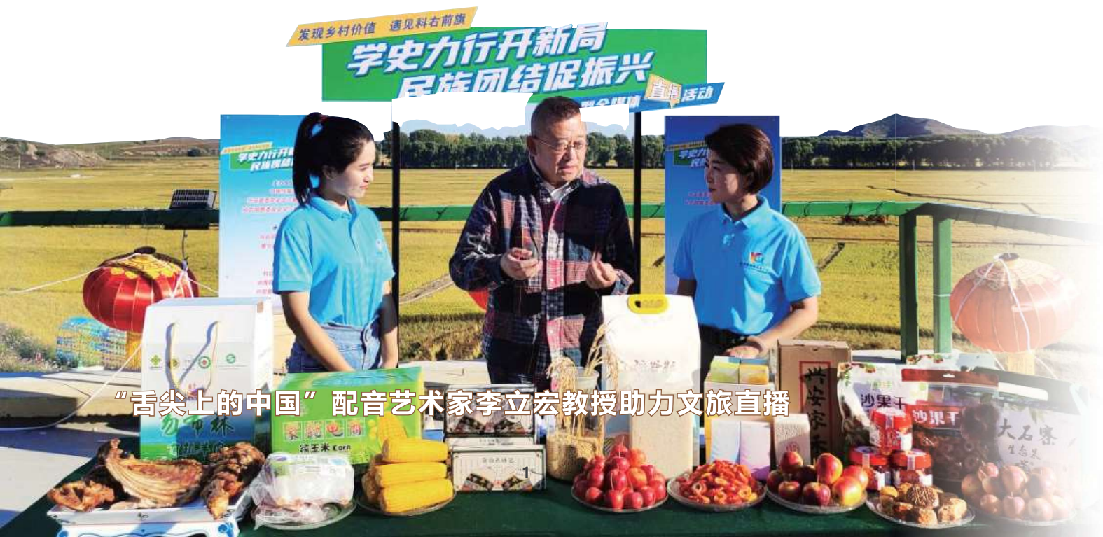
“舌尖上的中国”配音艺术家李立宏教授助力文旅直播