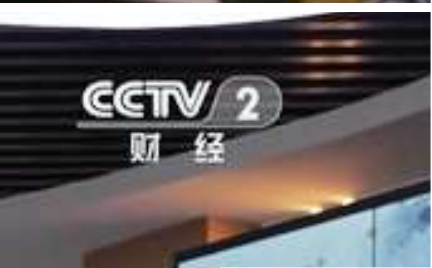
中央电视台 报道 “中传创扶” 成果