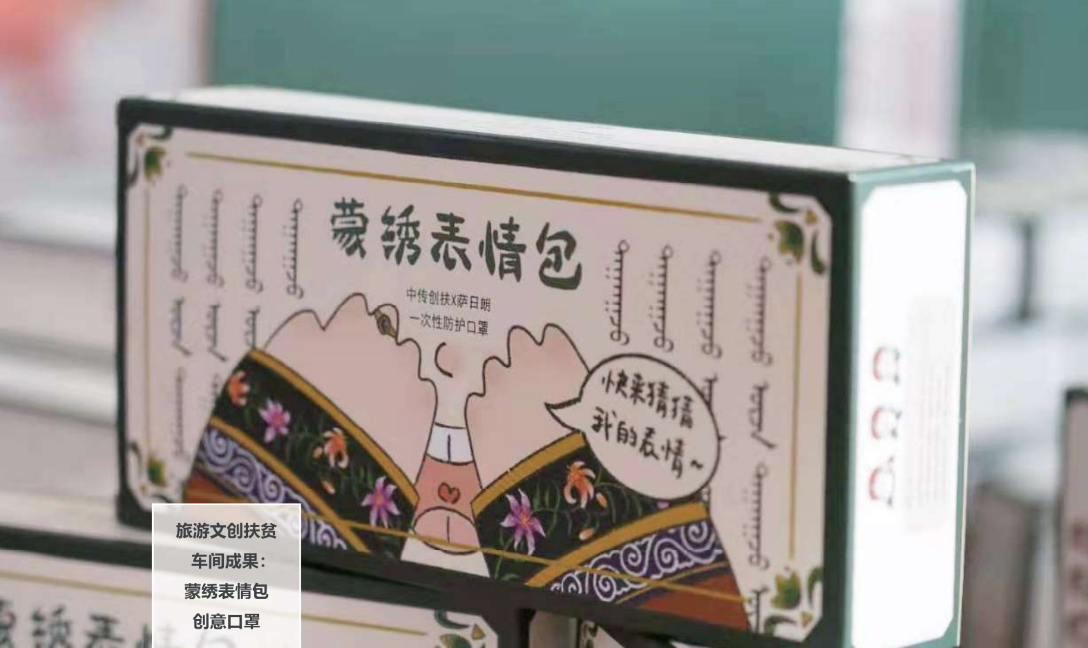
旅游文创扶贫 车间成果： 蒙绣表情包 创意口罩